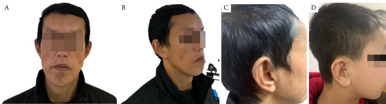
图2 患者父亲及本人头面部特征